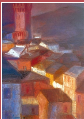
in copertina: Castelnuovo Magra di Bruno Pruno (olio su cartone telato, cm. 70x50, 1975)