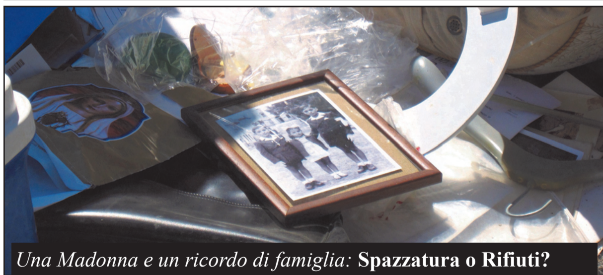
Una Madonna e un ricordo di famiglia: Spazzatura o Rifiuti?

Nonostante che il dibattito sulla dipendenza da gioco riempi le pagine dei giornali e i talk show a Castelnuovo stanno aprendo quattro mini casinò. Sale con insegne accattivanti ma che hanno ben mascherata la veduta dell'interno della sala per proteggere dalla vista dei passanti i disperati che tentano la fortuna rovinandosi. Eppure ci sembrava di aver letto che i comuni avrebbero applicato degli sgravi per quei bar che avessero rimosso dai loro locali le micidiali macchine mangiasoldi. È inutile rimuovere le macchinette dai bar se poi si concedono i permessi di allestire veri e propri casinò. I comuni non dovrebbero cedere alla lusinga di incassare qualche euro in più di tasse sulla pelle dei cittadini video-giochi-dipendenti. Ma questo lo Stato lo fa da sempre con il lotto e le concessioni governative sui vari giochi d'azzardo.