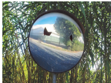
Via Carbone—Teatro Tenda