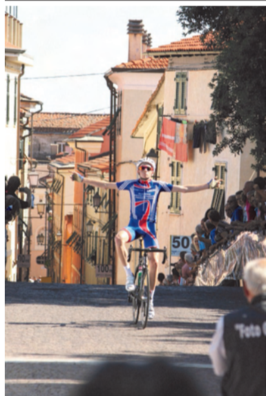
Il Britannico Geoghegan Hart taglia il traguardo a Castelnovo