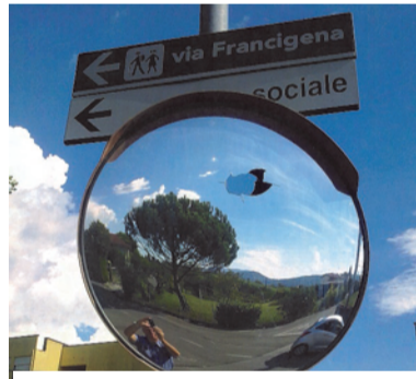
Via Carbonara—Centro Sociale