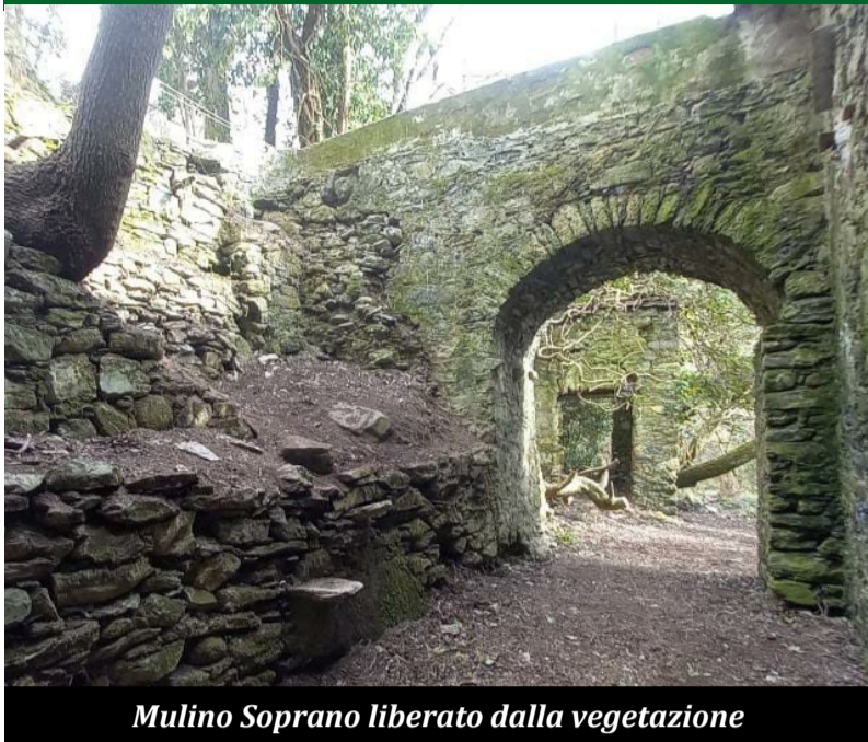
Mulino Soprano liberato dalla vegetazione