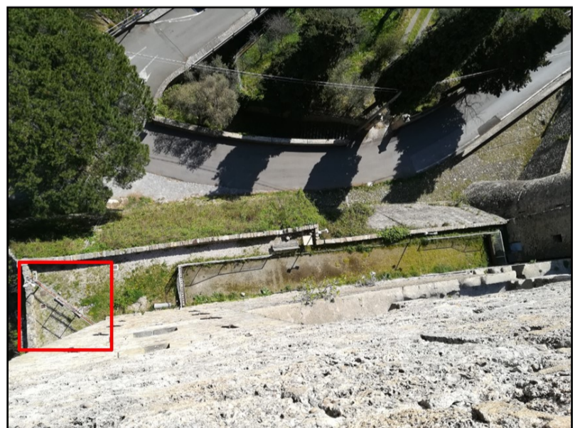
Foto presa dalla torre del castello, in cui si vede il campo che sembra ormai un prato. Nel riquadro la transenna.