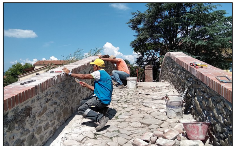
Operai al lavoro per il restauro dei muretti del ponte