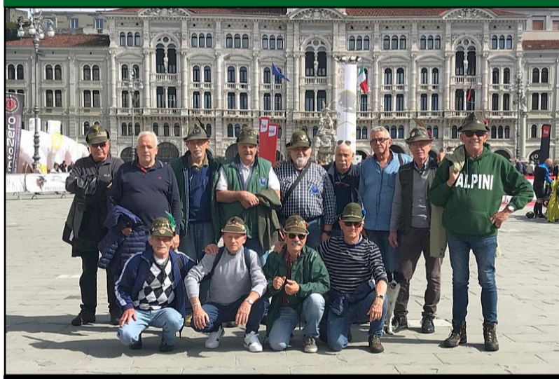
Il Gruppo Alpini Castelnovesi nella bella piazza Italia a Trieste

A maggio 85 mila alpini si sono radunati a Udine per la 94ª adunata nazionale a cui ha partecipato anche il Presidente del Consiglio Giorgia Meloni. Nell'occasione il Presidente della Repubblica Sergio Mattarella ha inviato un caloroso messaggio. Anche da Castelnuovo ne è partito un nutrito numero alla volta di Udine e di Trieste.