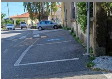
Lo stallo disabili in pendenza