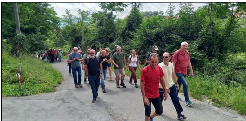
Gli escursionisti che hanno percorso la valle dei "mulini"