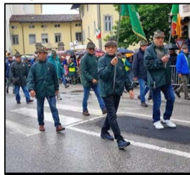
Gli Alpini Castelnovesi sfilano a Udine

A Castelnuovo, come tradizione, hanno partecipato alla raccolta alimentare coordinata dalla Caritas spezzina.