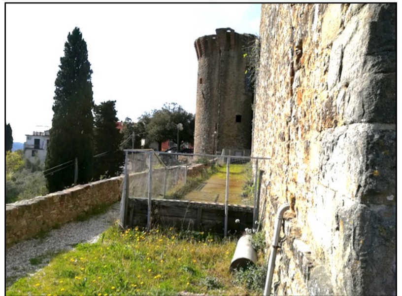
Foto che mostra il campo in abbandono presa da una maglia della griglia che transenna l'area.