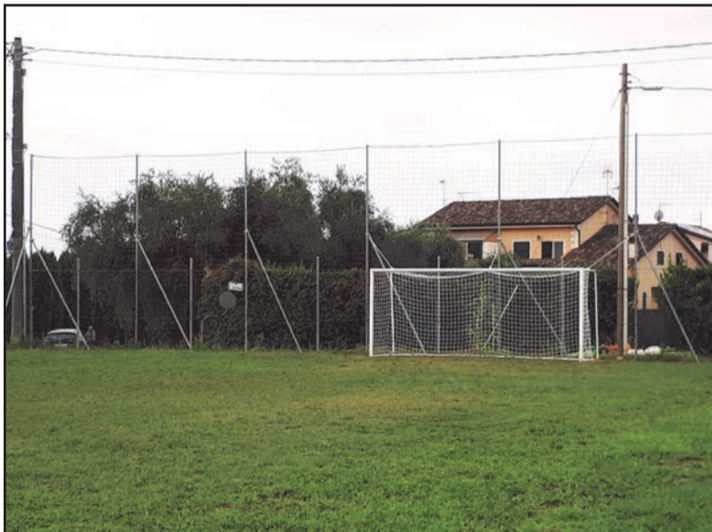
Stato di avanzamento dei lavori per il ripristino del campetto del Boschetto

Prenotazione obbligatoria 389 982 9961 - 339 804 4354