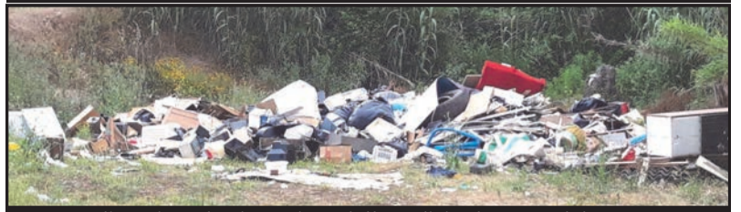
La discarica abusiva prima della pulizia da parte del comunw