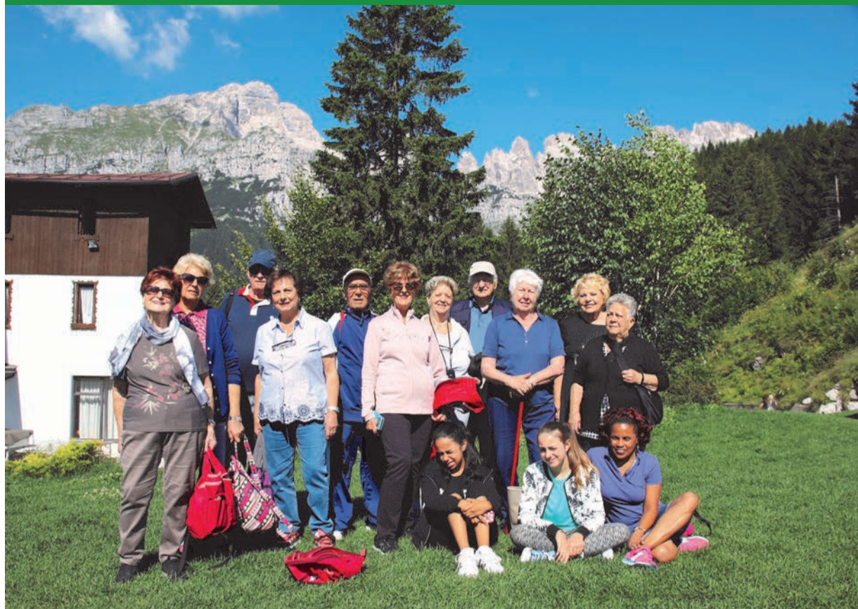
Alcuni partecipanti al soggiorno Auser-Orsa saliti al Pradel del gruppo delle Dolomiti del Brenta

Si è concluso felicemente il soggiorno estivo organizzato dall'Associazione Auser-Orsa di Castelnuovo nel verde e tra le montagne di Andalo, nel Trentino. Son stati dieci giorni intensi di attività montane e di visite culturali, di spettacoli e di relax.