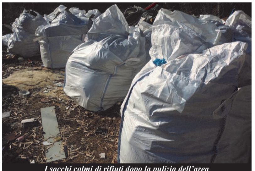
I sacchi colmi di rifiuti dopo la pulizia dell'area

Desidero ringraziare la Polizia Municipale di Castelnuovo per l'ottimo lavoro svolto, afferma il Sindaco, Daniele Montebello. Attraverso la telecamera mobile, recentemente acquistata, e la verifica puntuale degli abbandoni stiamo riducendo notevolmente le quantità di rifiuti raccolte al di fuori del circuito della raccolta differenziata. Lo dobbiamo a tutti quei cittadini che rispettano le regole e si impegnano nel riciclo dei propri rifiuti domestici.