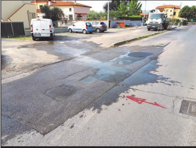
Via Provinciale: le varie toppe che si sono succedute in pochi giorni