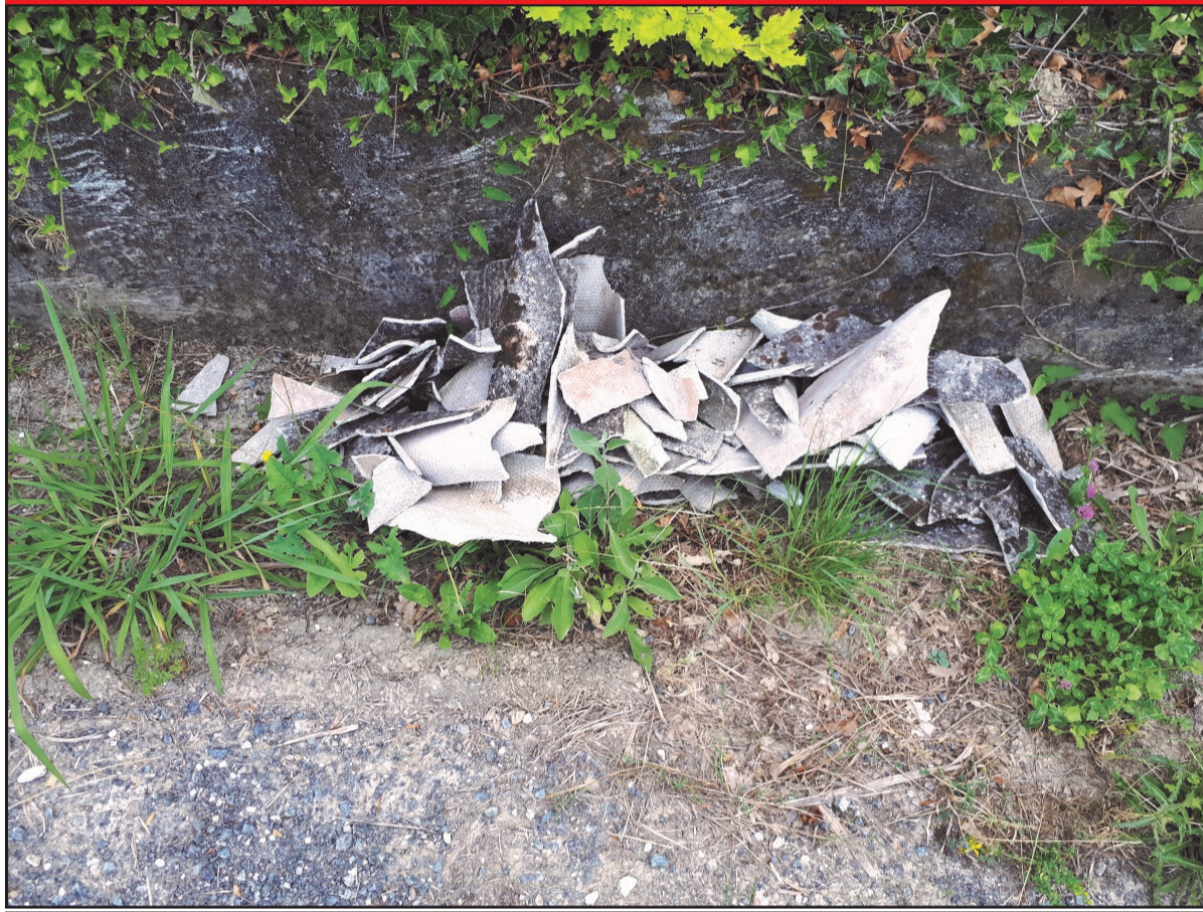
Amianto abbandonato in via Montefrancio

Ancora amianto abbandonato per le strade di Castelnuovo. Questa volta è stato scaricato in via Montefrancio, un po' sul lato destro e un po' sul lato sinistro in modo da distribuire il pericolo equamente tra chi sale e chi scende. È stato abbandonato senza la minima protezione. Non si sono degnati neanche di metterlo in un sacco. Il Comune di Castelnuovo appena informato ha provveduto a rimuoverlo, a