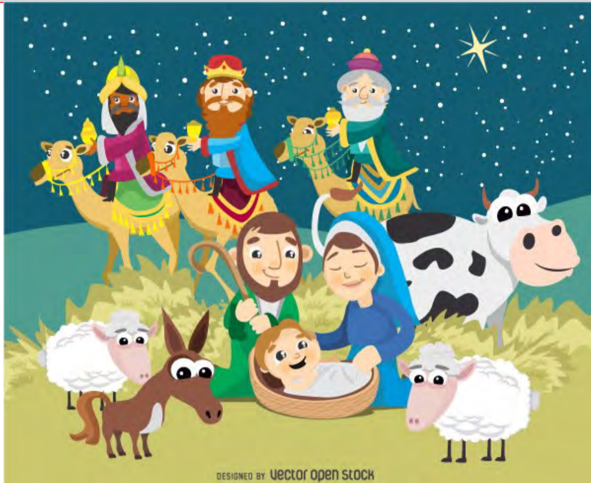
DESIGNED BY vector open stock