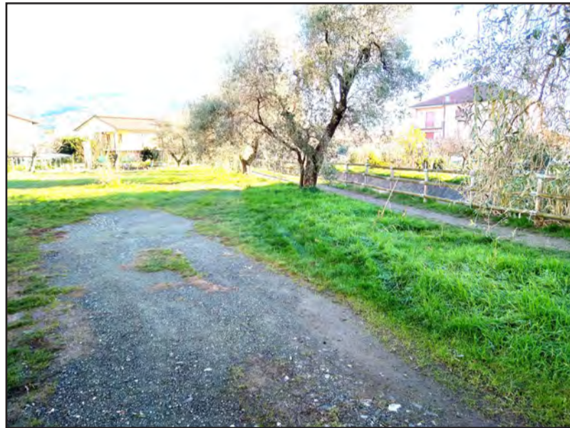
Spazio comunale destinato a "Area di Sosta" sul Canale Lunense.

Lucia Catani Consiglio di Frazione di Colombiera