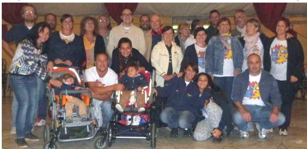
Foto di Gruppo dopo una manifestazione benefica degli "Amici del Giacò"

hanno lavorato sodo per renderlo più vivibile. La gestione è limitata all'ala sinistra del complesso, con annesso il bar, e nelle stanze adiacenti vi si tengono corsi di: yoga, danza per grandi e bambini, ginnastica dolce e riabilitativa. Vengono pure organizzati: compleanni, battesimi, feste di laurea ecc. Gli amici del Giacò collaborano pure con gli assistenti sociali e con quasi tutte le associazioni del nostro comune come "Vittoria", centro antiviolenza attivo nel giorno di sabato per incontri protetti, l'Auser, la P.A. di Castelnuovo e Luni, l'Arco Colombiera ed Arco Castelnuovo, Insieme per