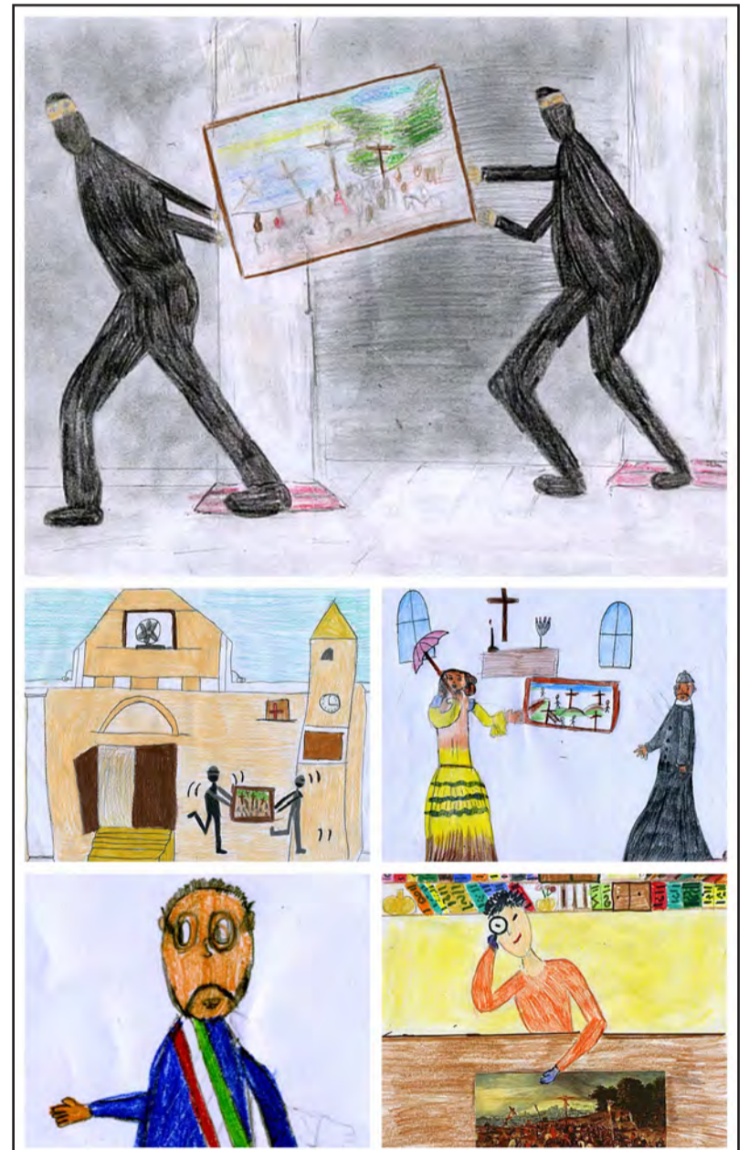
Alcuni disegni degli alunni che hanno illustrato il progetto per il concorso "Le meraviglie nascoste d'Italia"